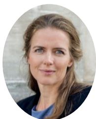
Sundhedsminister Ellen Trane Nørby

For at sikre fremdrift på området, vil vi som opfølgning på strategien gøre status efter 2 år med henblik på at kortlægge den samlede indsats.