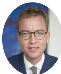
Miljø- og fødevareminister Esben Lunde Larsen